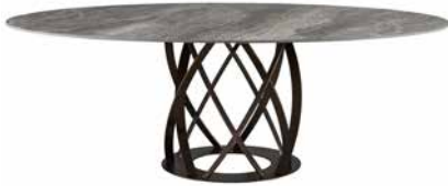
Table with central frame in painted or chrome-plated steel. Its top is made of glass or porcelain stoneware and is available in different sizes, finishes and colours.

Tavolo con struttura centrale in acciaio verniciato o cromato. Il piano viene realizzato in cristallo o gres porcellanato ed è disponibile in varie misure, finiture e colori.